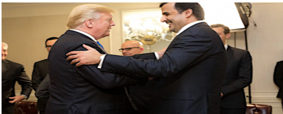
ترامپ و امیر قطر، مجمع عمومی سازمان ملل، اکتبر ۲۰۱۷، عکس کاخ سفید

این یک شکست ژئوپولیتیک مطلق است. پس این چه نوع اتحادی‌ست؟